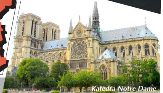
Katedra Notre Dame